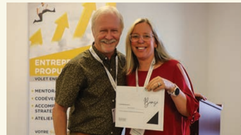
Soirée reconnaissance des mentors du 4 juin 2025

Les mentors posent les bonnes questions, celles qui permettent de réfléchir, de se recentrer et d'avancer avec confiance.